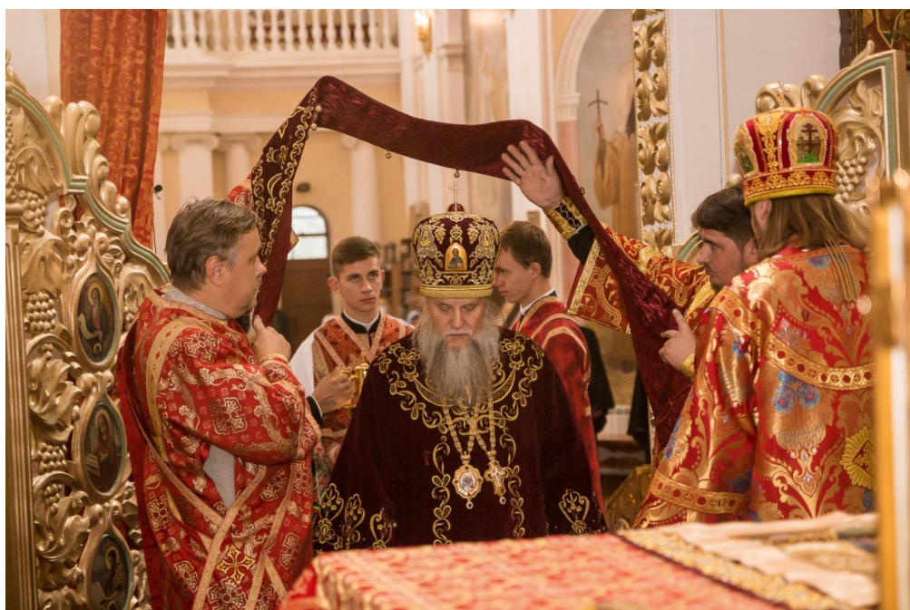
Божественная литургия Тульчинский кафедральный Христо-Рождественский собор В центре митрополит Тульчинский и Брацлавский Ионафан (Елецких)

Митрополит Ионафан (Елецких) — иерарх Русской Православной Церкви, родился в 1949 году в России, русский, кандидат богословия. В 1989 г. определением Священного Синода РПЦ и указом Святейшего Патриарха Пимена рукоположен в сан епископа. Был первым наместником возвращённой Церкви Киево-Печерской Лавры, управляющим делами УПЦ (МП), руководил рядом епархий. С 28.08.2014 года – митрополит, член синодального Патриаршего совета по культуре (МП), член комиссии Священного Синода РПЦ по взаимодействию со старообрядными приходами РПЦ и старообрядчеством. Автор литургическо-богословских трудов: «Толковый путеводитель по Божественной Литургии» (рус., укр.), переложений на славянорусское наречие и на русский язык (в стиле верлибр) Великого покаянного канона святого Андрея Критского, ряда акафистов, статей, духовных и патриотических стихов, мемуаров о становлении канонической УПЦ, почётный член Союза композиторов Украины. Наиболее известные музыкальные сочинения: хоровая «Чернобыльская литургия», посвящённая памяти погибших ликвидаторов аварии на Чернобыльской АЭС, и, в сотворчестве с оркестровым оранжировщиком, сценическая симфоническо-хоровая поэма-реквием; «Литургия мира» на материале западных старинных латинских напевов, степенные антифоны утрени древних напевов, «Чертог твой», «Плотию уснув», «С нами Бог» соловецкого напева, «Ныне сиды небесныя» валаамского напева, другие духовные песнопения и гимны.